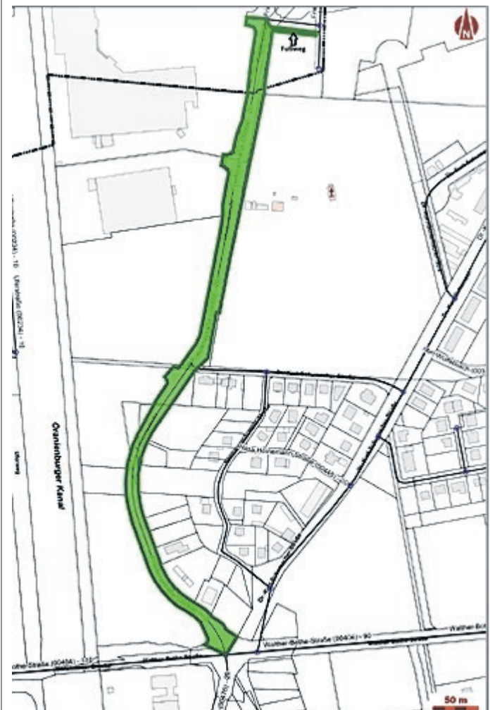
Widmungsfläche der „Friedensstraße“ in Oranienburg (Abschnitte 10, 20 und 50 tw.)