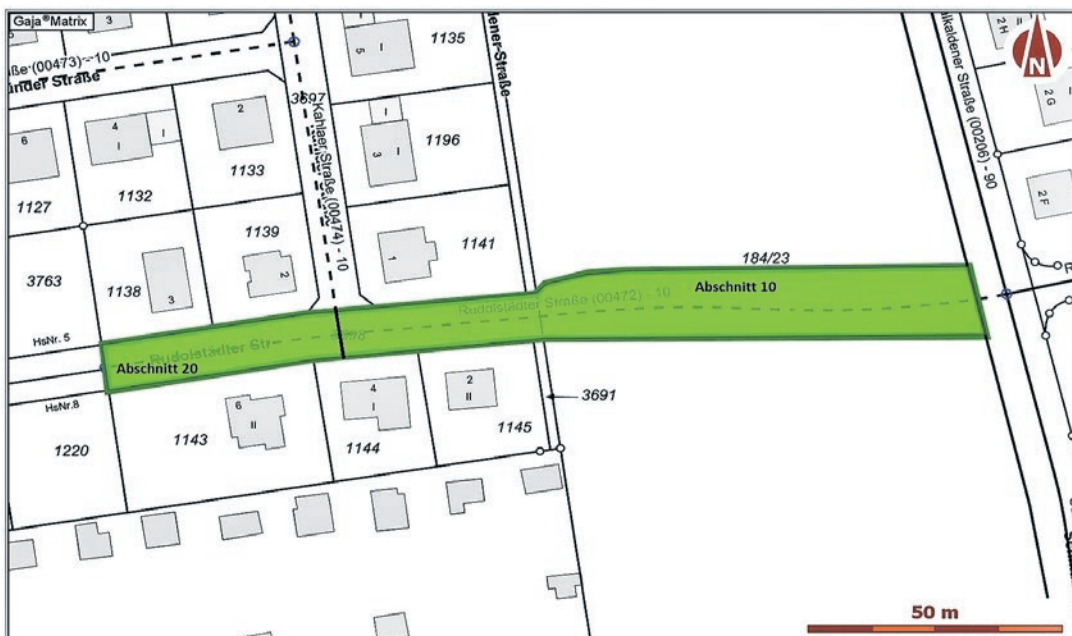
Widmungsfläche der Rudolstädter Straße (Abschnitte 10 und 20) in Oranienburg: