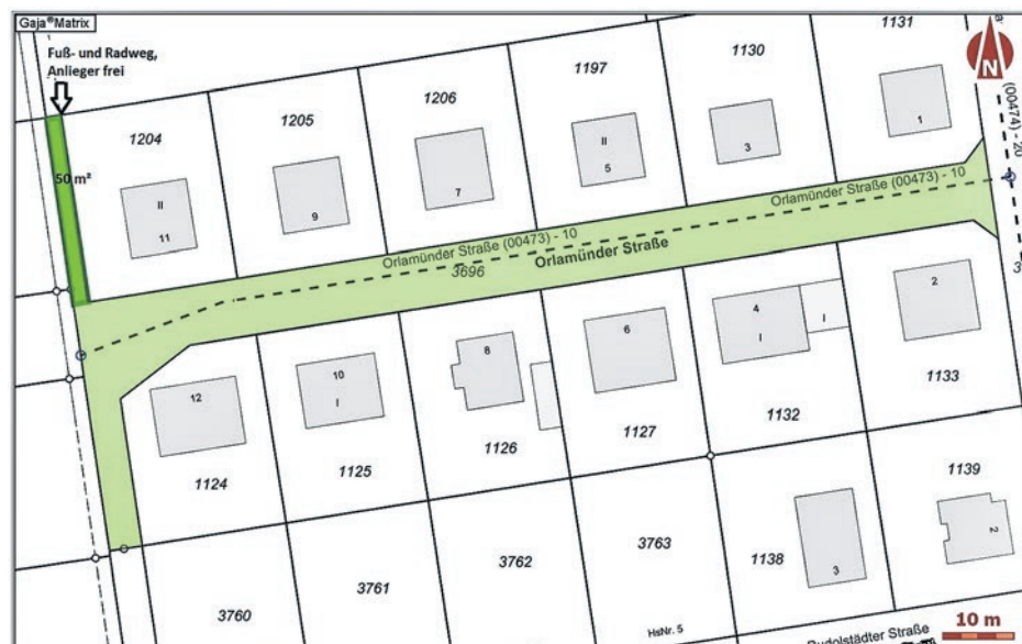
Widmungsfläche der Orlamünder Straße (Abschnitt 10) in Oranienburg :